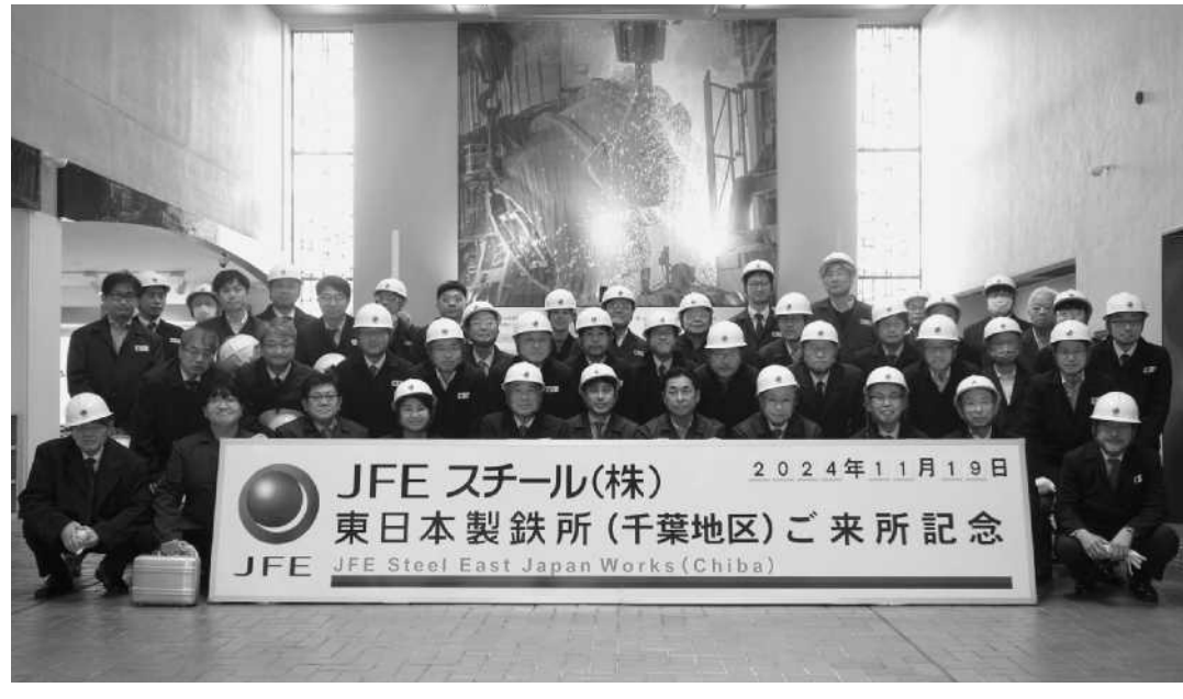
JFE スチール(株) 2024年11月19日 東日本製鉄所(千葉地区)ご来所記念 JFE JFE Steel East Japan Works (Chiba)